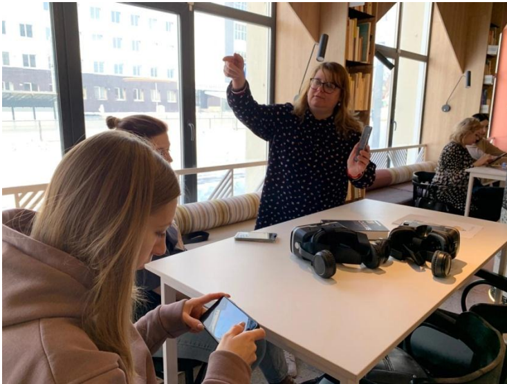
Лаборатория VR – дизайнера