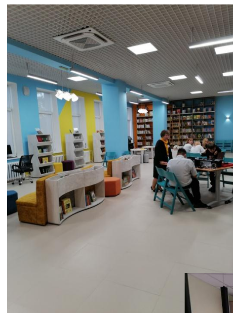
детская библиотека с. Долгодеревенское 2022 год