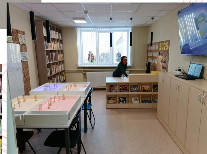
детская библиотека с. Октябрьское 2024 год