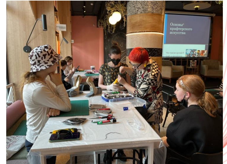
Лаборатория косплея. Мастер-класс