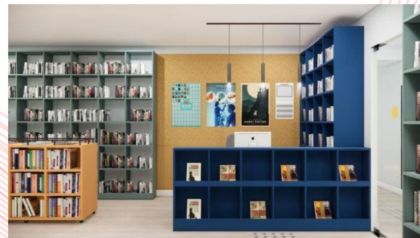
ЦБ Октябрьский район