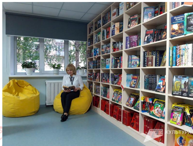
ЦГБ им. А. Г. Туркина г. Верхний Уфалей