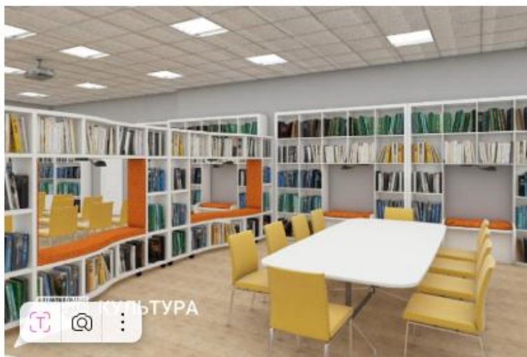
ЦБ Варненский район