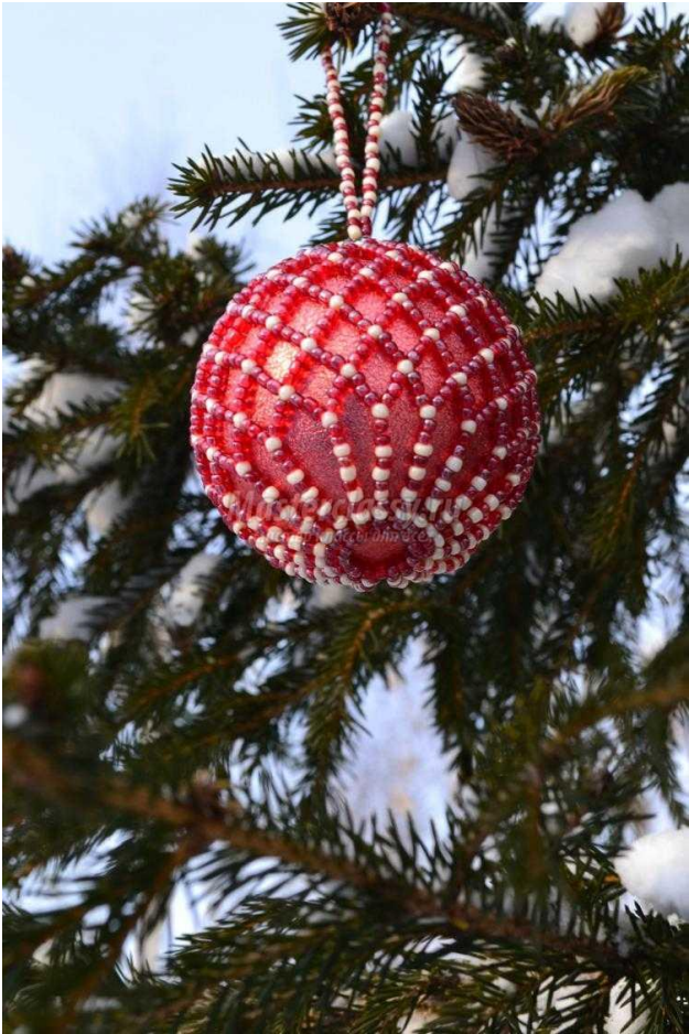
Фото готовой работы